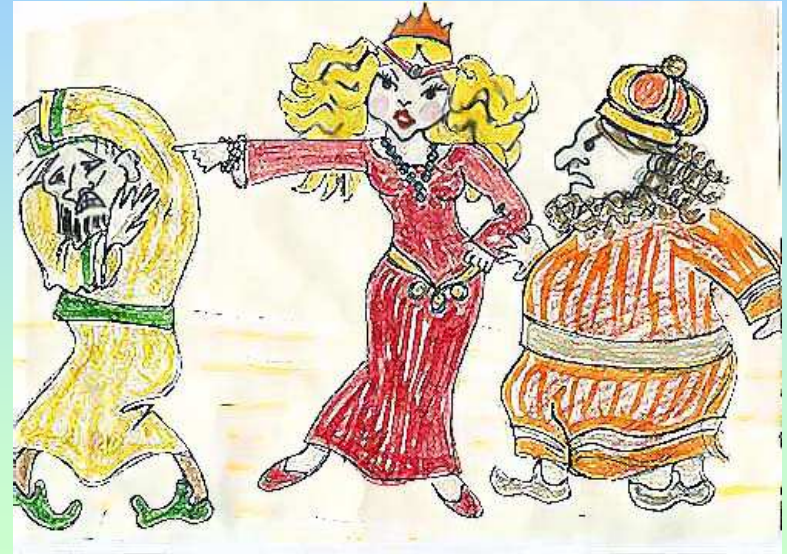
נוצר על-ידי לאה.ס.

הַצִּיל אֶז הִי אֶת-עַמוֹ מִצָּרָה, תָּלוּ עַל הָעֵץ אֶת הַמֶּן הַרְשָׁע. הִיָּתָה לַיהוּדִים אֶז שְׂמָחָה גְדוֹלָה, כֹּל-זֶה מְסַפֵּר כֹּה יָפָה בַּמְּגִלָּה.