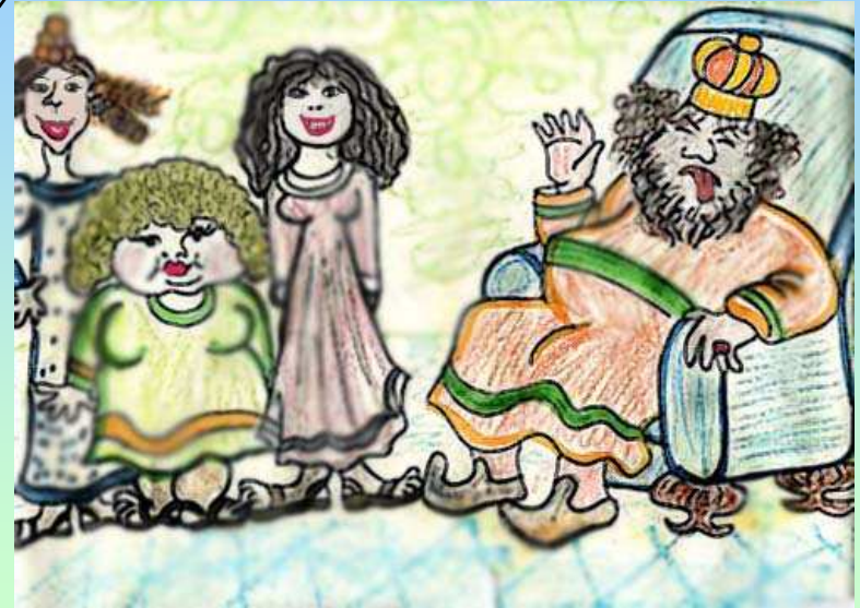
נוצר על-ידי לאה.ס.

אֶת אֲסֵתֶר הִיָּפָה לָקַח לוֹ לְאִשָּׁה וְכִתֶּר מַלְכוּת נָתַן בְּרֵאשִׁיָּה.