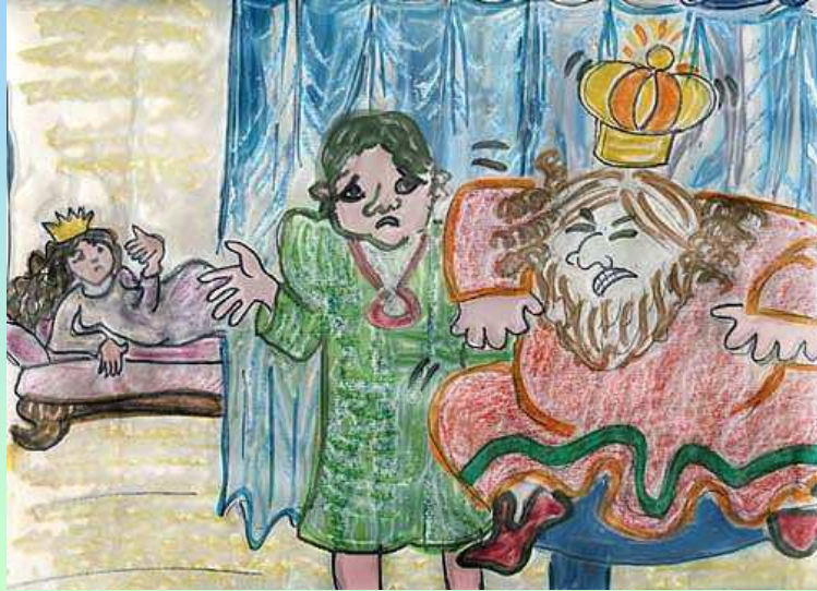
נוצר על-ידי לאה.ס.

הַמֶּלֶךְ עָשָׂה מִשְׁתֵּה לְאֲנָשֵׁי מַמְלַכְתּוֹ אֵךְ וְשִׁתֵּי הַמֶּלֶכָּה סִרְבָּה לָבוֹא אֶחְשׂוּרוֹשׁ הָיָה מֶלֶךְ מִדֵּי וּפָרַס אֶת אִשְׁתּוֹ גֵּרֶשׁ, כִּי עָלְיָה כָּעַס