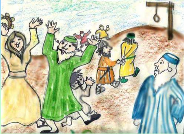
נוצר על-ידי לאה.ס.

הַצִּיל אֶז הִי אֶת-עַמוֹ מִצָּרָה, תָּלוּ עַל הָעֵץ אֶת הַמֶּן הַרְשָׁע. הִיָּתָה לַיהוּדִים אֶז שְׂמָחָה גְדוֹלָה, כֹּל-זֶה מְסַפֵּר כֹּה יָפָה בַּמְּגִלָּה.