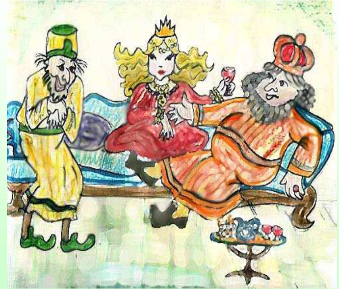
נוצר על-ידי לאה.ס.

הַמֶּלֶךְ עָשָׂה מִשְׁתֵּה לְאֲנָשֵׁי מַמְלַכְתּוֹ אֵךְ וְשִׁתֵּי הַמֶּלֶכָּה סִרְבָּה לָבוֹא אֶחְשׂוּרוֹשׁ הָיָה מֶלֶךְ מִדֵּי וּפָרַס אֶת אִשְׁתּוֹ גֵּרֶשׁ, כִּי עָלְיָה כָּעַס