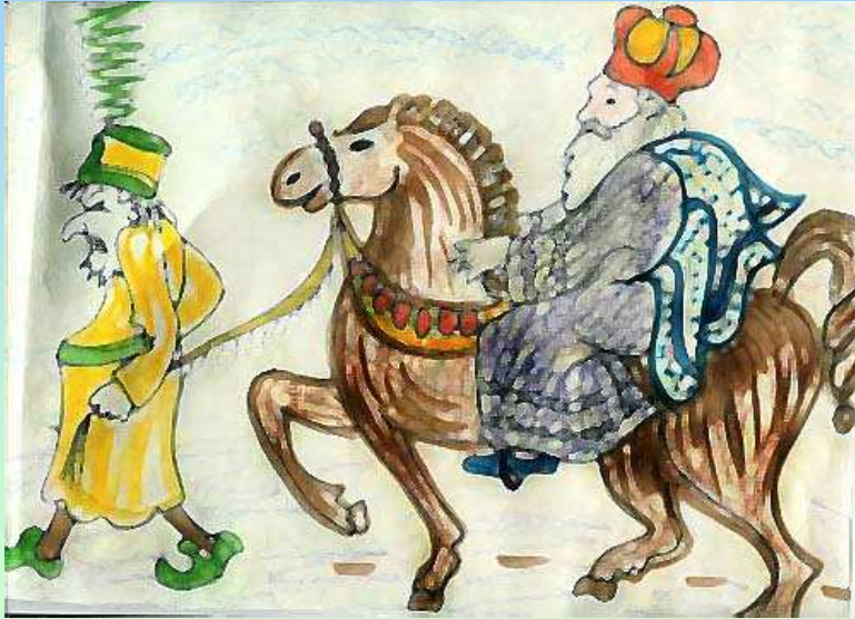
נוצר על-ידי לאה.ס.

את מֶרְדְּכִי הֶרְכִּיבוּ עַל סוּס אַבִּיר וְהָמֹן הִכְרִיז בְּכָל הָעִיר: "כִּכָּה יַעֲשֶׂה לְאִישׁ אֲשֶׁר הִמְלִיךְ חֶפְצוֹ בִּיקָרוֹ"