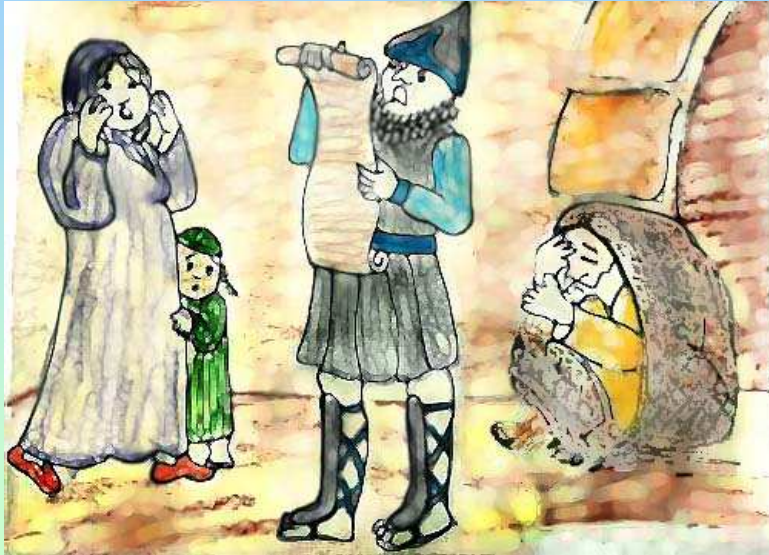
נוצר על-ידי לאה.ס.

נִפְל הַפּוֹר, וּפְרָסִים בְּרַבִּים, יִהְיֶה מֵר וְאַכְזָר גּוֹרֵל הַיְּהוּדִים.