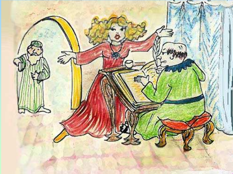
נוצר על-ידי לאה.ס.

אַסְתֵּר מִהֲרָה אֶת הַמְּקָרָה לְסַפֵּר וְלִרְשׁוֹם הַדְּבָרִים עַל-יְדֵי הַסּוֹפֵר