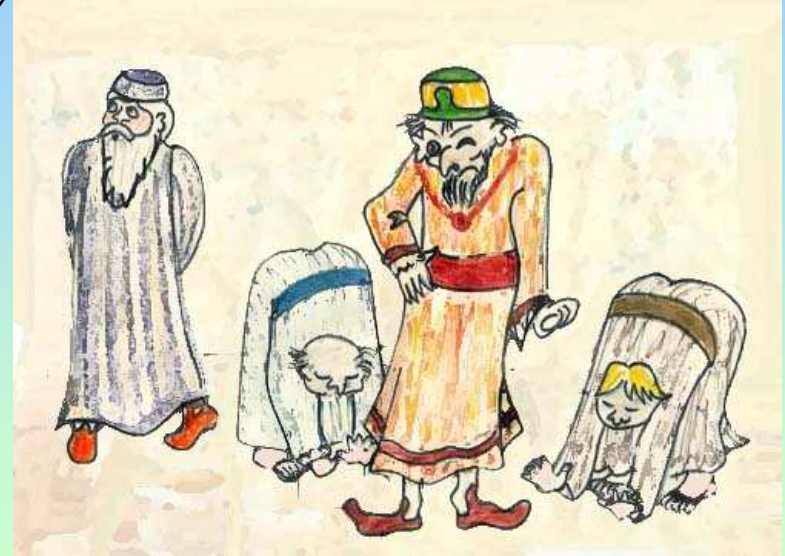
נוצר על-ידי לאה.ס.

נִפְל הַפּוֹר, וּפְרָסִים בְּרַבִּים, יִהְיֶה מֵר וְאַכְזָר גּוֹרֵל הַיְּהוּדִים.