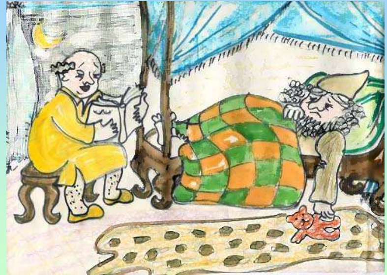
נוצר על-ידי לאה.ס.

את מֶרְדְּכִי הֶרְכִּיבוּ עַל סוּס אַבִּיר וְהָמֹן הִכְרִיז בְּכָל הָעִיר: "כִּכָּה יַעֲשֶׂה לְאִישׁ אֲשֶׁר הִמְלִיךְ חֶפְצוֹ בִּיקָרוֹ"