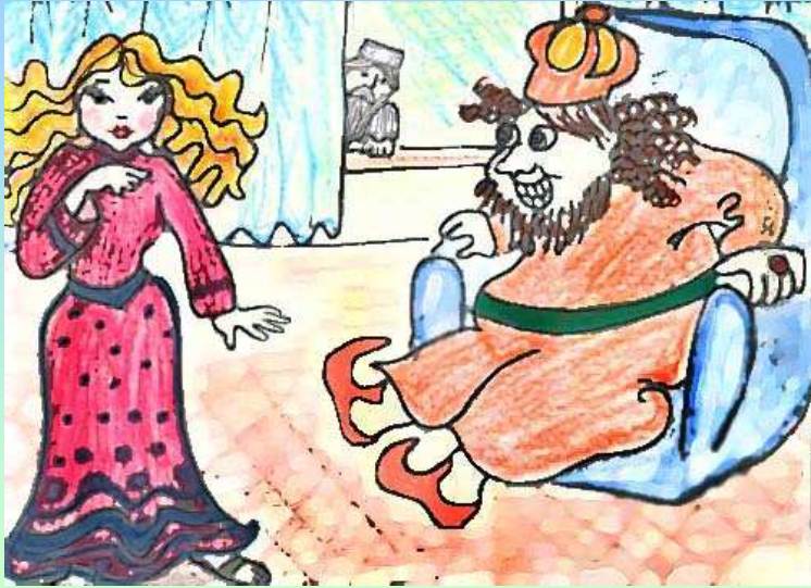
נוצר על-ידי לאה.ס.

אֶת אֲסֵתֶר הִיָּפָה לָקַח לוֹ לְאִשָּׁה וְכִתֶּר מַלְכוּת נָתַן בְּרֵאשִׁיָּה.